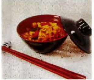
▲炊き出しメニューとして考案

選考は一次（書類）、二次（エピソード）、Web投票、最終（調理）によって行われた。二次選考はオンラインで行われ、スライドと手作りのマスクットを使った寸劇を織り交ぜて、制限時間5分以内に料理に込めた想いをアピール。神戸で生まれ、防災教育を受けて育ってきた彼女たちは、被災者が避難所で少しでも笑顔になり、食の力で前向きになつてもらえるようにとレシピを考案した。イタリア発祥の野菜スープ・ミネストローネに兵庫の特産品である「搦保乃糸」のそうめんを合わせ、最後につみれ団子をのせた一品。鶏胸肉と明石鯛をミ