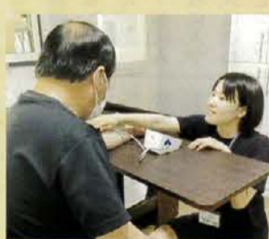
▲バイタルチェック