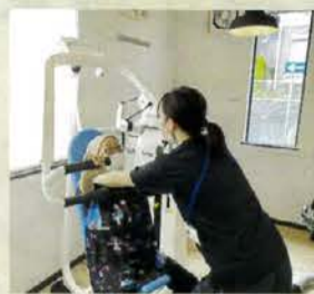
▲マシントレーニング