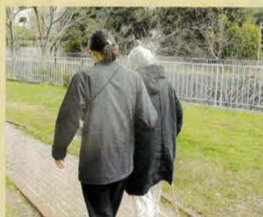
▲訪問リハビリの様子