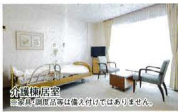
介護棟居室 ※家具・調理品等は備え付けではありません。

施設があり、住宅棟のご入居者は自由に利用でき、介護が必要になっても住み慣れた住戸での介護を基本としながら、住宅棟から介護棟への移行も可能。 ただ今、介護棟の新規ご入居者を対象に前払金半額キャンペーンを実施中（令和8年6月末まで）。介護棟は全室個室で、訪問者もくつろげる28㎡の間取りがあり、フルフラット設計なのでストレスや不安を感じることがなく、安全に過ごすことができ、愛用の家具や思い出の品に囲まれ、これまで通りの暮らしを続けられる居室になっている。 また、介護状態が同程度の人たちがフロアを分け、ユニット単位で最適なケアを行う。ユニット9戸から13戸の少人数で構成し、なじみのメンバー、なじみのスタッフとともに、家族といえるように過ごさせ、大 集団によるストレスや孤独感を味わう心配のない、温かなコミュニケーションが育まれている。一人ひとりの心身の状況に応じた個別ケアプランを看護・介護スタッフがよく把握し、パーソナルな介護サービスを実施。認知症ケアにも積極的で、土や人とのふれあいや、五感をイキキと刺激する園芸療法を行っている。24時間看護・介護スタッフが常駐しており、昼夜を問わず安心して過ごすことができる。キャンペーンの詳細など、まずは一度お問い合わせを。