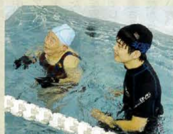
▲温水プールでのトレーニング