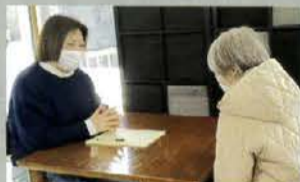
▲ケアマネジャーによる 各種在宅サービスの相談も可能