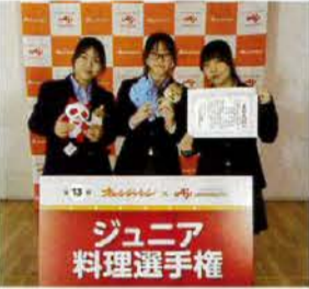
▲コンテストの表彰式

ンチ状にし、玉ネギ、ゴボウ、片栗粉、味噌を加えて成形し、フライパンで焼いた。味噌は六甲、玉ネギは淡路、キャベツは神戸、ゴボウは丹波と兵庫の農産加工品をふんだんに盛り込んだ。調理方法も試行錯誤した。つみれの鶏胸肉と明石鯛の配合を変えて何種類も試作し、菌応えや旨みが一番よいものを見つけた。そうめんを下茹でせずに直接スープに入れて味がしみ込みやすくなることを発見したり、試作を重ねるごとにレシピが進化していった。避難所の炊き出しメニューとして、平時から備蓄しておきやすいトマト缶、そうめん、コンソメ、水をメインで使うことも考慮している。試作した料理は部員のほかに教職員にも試食を頼み、料理の感想やオンライン審査の見せ方について意見をもらった。最終選考の直前には明石の魚の棚商店街で材料を頼み、横浜まで郵送してもらった。届いた箱の中には食材と一緒に一通の手紙が入っていた。