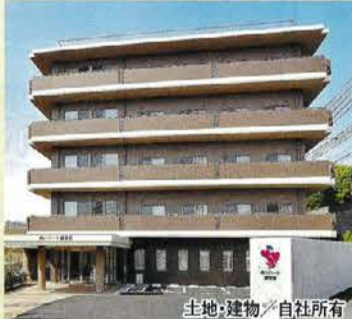
土地・建物/自社所有

閑静な住宅地にたたずむ眺望に恵まれた好立地。広々とした交流スペースなど、静けさと開放感の中で、ゆったりとした毎日をお過ごしいただけます。季節の行事や日々のアクティビティーなど、介護サービスとホテルサービスが融合した上質のホスピタリティーをご提供します。