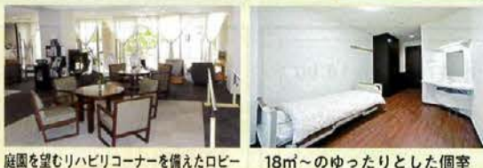
庭園を望むリハビリコーナーを備えたロビー 18㎡～のゆったりとした個室