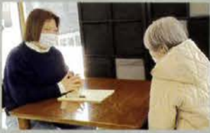
▲ケアマネジャーによる 各種在宅サービスの相談も可能