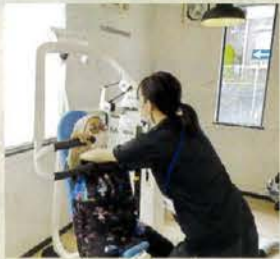
▲マシントレーニング