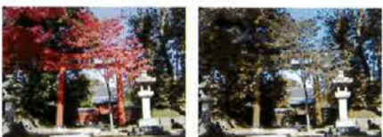
正常の見え方 色覚異常の見え方の一例(赤が感知しにくい場合)

生まれ持った感覚なので、異常を自覚することはない。自身の色覚異常を知らない場合も多い。平成15年より色覚検査は学校検診の必須項目でなくなり、就職時期を迎え進路断念などのケースが増えた。そのため、平成