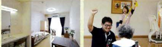
プライバシーに配慮したゆとりのある個室 リハビリ専門スタッフによる運動プログラム