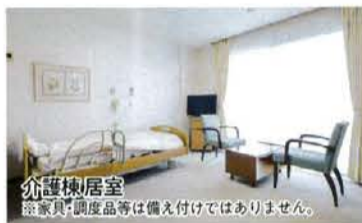
介護棟居室 ※家具・調度品等は備え付けではありません。

施設があり、住宅棟のご入居者は自由に利用でき、介護が必要になっても住み慣れた住戸での介護を基本としながら、住宅棟から介護棟への移行も可能。 ただ今、介護棟の新規ご入居者を対象に前払金半額キャンペーンを実施中（令和8年6月末まで）。介護棟は全室個室で、訪問者もくつろげる28㎡の広さがあり、フルフラット設計なのでストレスや不安を感じることがなく、安全に過ごすことができ、愛用の家具や思い出の品に囲まれ、これまでの暮らしを続けられる居室になっている。