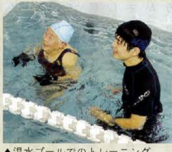
▲温水プールでのトレーニング