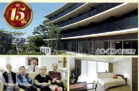
土地・建物/自己所有

フォレスト垂水式番館にて毎週元気に開催中 神戸大学監修の「コグニケア®」 認知症予防・健康づくりサービス コグニケアとは認知症や生活習慣病の「予防」に良いとされる研究成果をもとに神戸大学の研究所が開発したヘルスケア・サービスです。