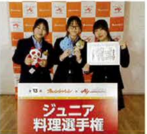
▲コンテストの表彰式