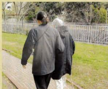
▲訪問リハビリの様子