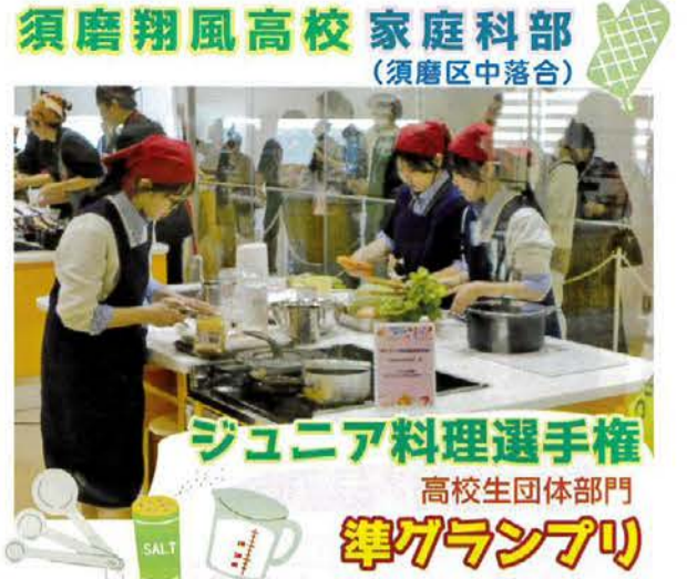
11月30日(日)、味の素グループうま味体験館(横浜市川崎町)で行われた「第13回オレンジページ味の素(株)ジュニア料理選手権 高校生団体部門」の決勝戦において、神戸市立須磨翔風高等学校 家庭科部が準グランプリを受賞した。(主催/オレンジページ味の素(株))

選考は一次（書類）、二次（エピソード）、Web投票最終（調理）によって行われた。二次選考はオンラインで行われ、スライドと手作りのマスケットを使った寸劇を織り交ぜて、制限時間5分以内に料理に込めた想いをアピール。神戸で生まれ、防災教育を受けて育ってきた彼女たちは、被災者が避難所で少しでも笑顔になり、食の力で前向きになつてもらえるようにとレシピを考案した。イタリア発祥の野菜スープ・ミネストローネに兵庫県の特産品である「揖保乃糸」のそうめんを合わせ、最後につみれ団子をのせた一品。鶏胸肉と明石鯛をミ