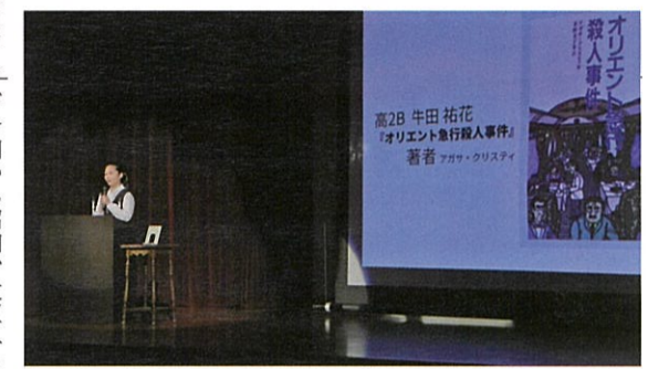
学園祭ビブリオバトルの様子

で質問や感想をやり取りし、最も読みたかった本(チャンプ本)を投票で決めるというもの。生徒たちは本に触れる機会が増え、プレゼンテーション能力の向上や生徒同士のコミュニケーションの場にも繋がっており、数年前から同校学園祭での発表プログラムの一つになっている。