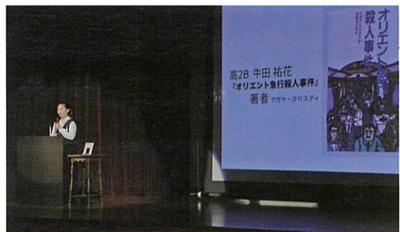
学園祭ビブリオバトルの様子

で質問や感想をやり取りし、最も読みたかった本(チャンプ本)を投票で決めるというもの。生徒たちは本に触れる機会が増え、プレゼンテーション能力の向上や生徒同士のコミュニケーションの向上にも繋がっている。