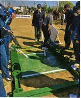
プラットフォーム