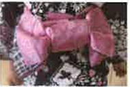
花文庫結びの個性が出ていてよかったです」と話した。