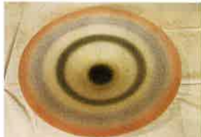
灰釉彩鉢「月華」川村良幸さん