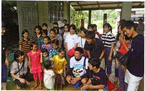
HIV感染児童支援施設(孤児院)訪問