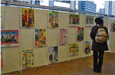
「愛の輪ポスター」「障害者週間のポスター」受賞作品展示