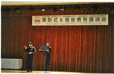
「福祉体験作文」「心の輪を広げる体験作文」応募作品から優秀作の披露