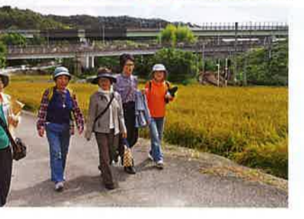
その見方を自作のボール紙とひもで解説するなどのレクチャーがあった。