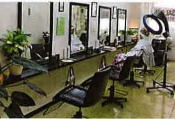
老舗ならではの独特のなつかしい雰囲気、落ち着いた静かな空間が迎えてくれる。 第1、3、5土曜日2時からピアノ生演奏あり

商店街の路地を少し南に入り、階段を上った2階。元町駅から徒歩3分。南京町すぐそばの便利な立地ながら、都会の喧騒を忘れさせてくれるアットホームな店内は、シニアの方でも入りやすい。同サロンが今オススメするのは、髪が健康になると評判の「ゴッホスタイリングカラー・パーマ」。まともな髪毛という悩みを持つ人には朗報。髪だけではなく地肌まで潤いを与えダメージを修復してくれるので、やればやるほど髪が美しくなるといいます。ムラなくキレイに染まり、